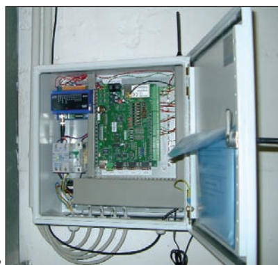
Bild 1: Zentrale Erfassung und Auswertung aller Verbrauchsdaten mit der »Smartbox«